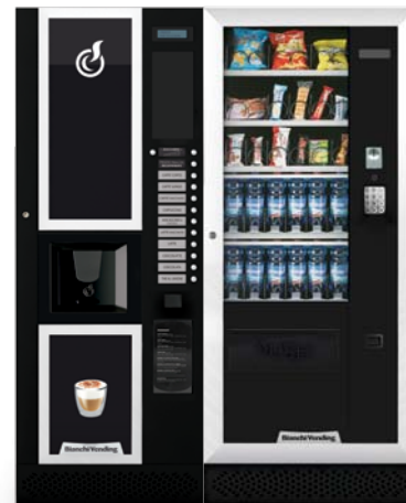
LEI400 + ARIA M MÁSTER